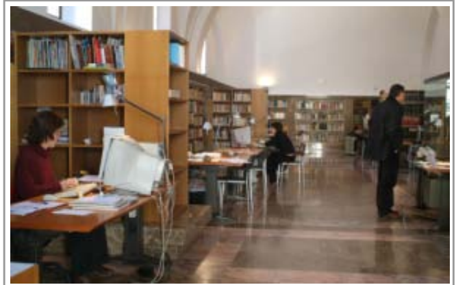
Sala de lectura de l'Arxiu Municipal de Girona

Aquest és un fet inqüestionable però també penso que és desitjable que sigui així. Tots els arxius del món que han "penjat" contingut als seus webs han vist disminuir els seus usuaris presencials. L'explicació és