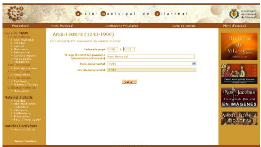
Figura 1: Exemple de recerca en la web actual

Com s'hi pot observar, només es poden realitzar les recerques pel contingut de la recerca i l'any. Tanmateix, una vegada obtingut el regist es pot accedir a més informació i, en molts casos, al mateix document digitalitzat. La plana web també permet accedir a material didàctic i presentacions relacionades amb la història de Vila-real.